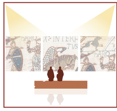
Introduction à l'objet