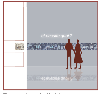
Extension de l'objet