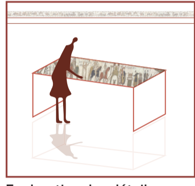
Exploration des détails