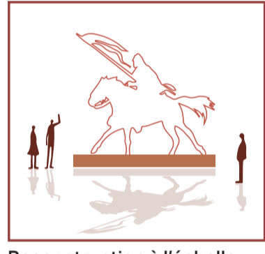
Reconstruction à l'échelle